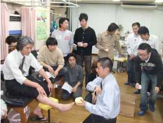
ニチバン・テーピング勉強会