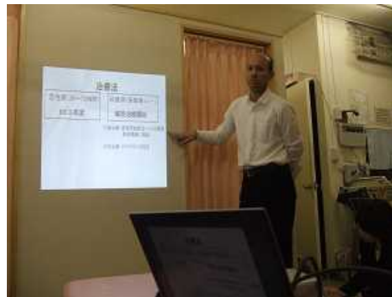
クリニック・レントゲン読影勉強