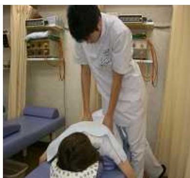
マニピレーション