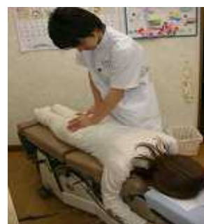
カイロプラクティック